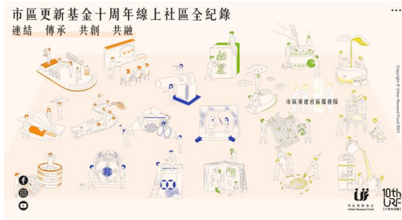
(圖片一：市區更新基金十周年線上展覽)