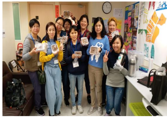
聖雅各福群會於九龍城: 鴻福街/銀漢街及鴻福街/啟明街及榮光街及啟德道/沙浦道提供服務