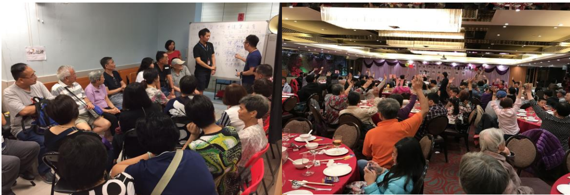
聖雅各福群會於九龍城: 鴻福街/銀漢街及鴻福街/啟明街及榮光街提供服務